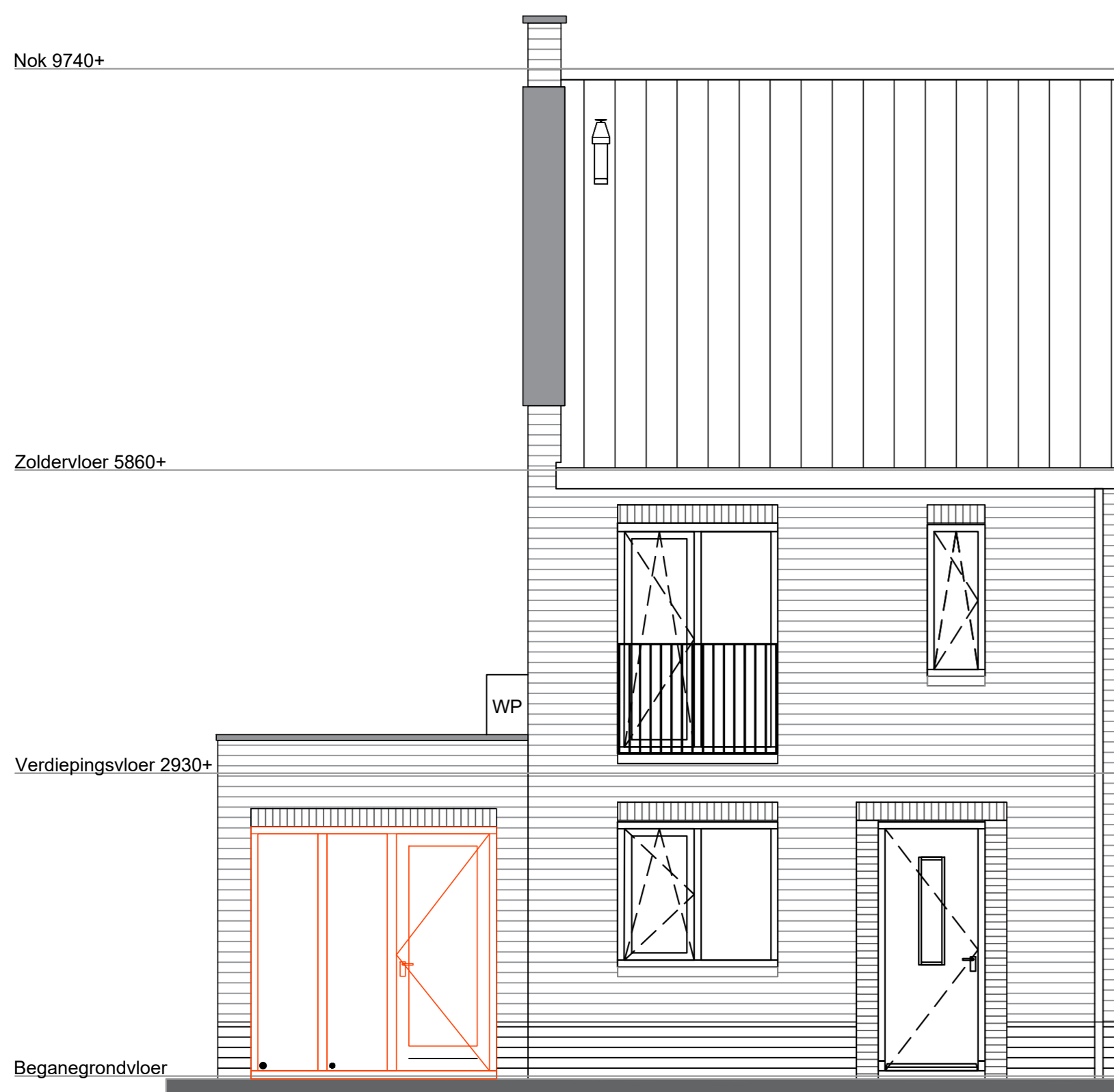
Optie B13AC isoleren buitenberging + B22AC deurkozijn met zijlichten