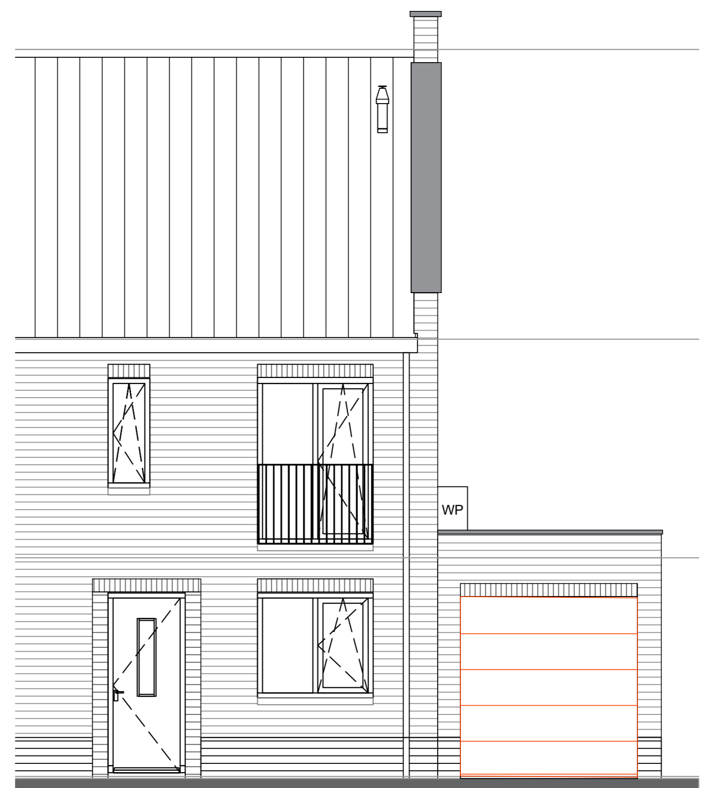
Optie B13AC isoleren berging